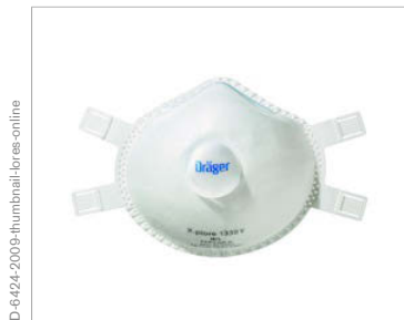
Respirez mieux avec la valve expiratoire CoolMAX™