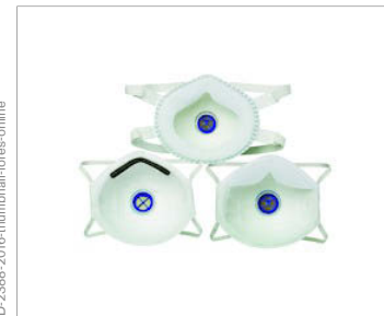
Une étanchéité efficace sans fuite