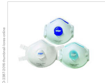
Code couleur pour une identification rapide de la classe de protection