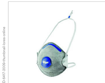
Couche de charbon actif contre les mauvaises odeurs