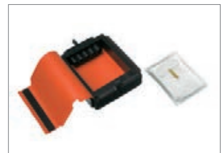
Dräger TO 7000 Para abrir los tubos Dräger de forma rápida y segura