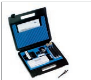
Sistemas Dräger Aerotest

Dräger ha desarrollado una amplia gama de sistemas de medición para cumplir con los requisitos en diferentes aplicaciones y combinarlos como sets completos. Los kits de tubos Dräger ofrecen resultados rápidos y eficientes.