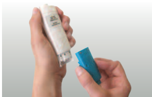
Cambio sencillo de sonda en los testo 206-pH1/-pH2/-pH3