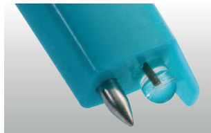
testo 206-pH1: sonda pH1 para líquidos