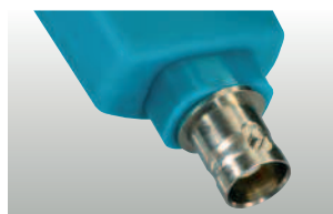
testo 206-pH3: Electrode pH 3 avec interface BNC