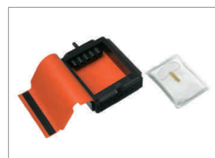
Dräger TO 7000 Per l'apertura facile e sicura delle fiale Dräger