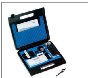
Sistemi Dräger Aerotest

Dräger Safety ha sviluppato una gamma di sistemi di misurazione in grado di soddisfare le esigenze delle diverse applicazioni e li ha raggruppati in pacchetti completi. I kit per fiale Dräger producono risultati affidabili con rapidità ed efficienza.